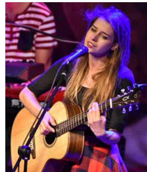
Zdroj: René Miko

Snažiť sa milovať seba, rovnako ako aj druhých.